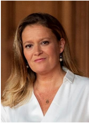
Olivia Grégoire Ministre déléguée chargée des Petites et Moyennes Entreprises, du Commerce, de l'Artisanat et du Tourisme

Au cœur du plan Destination France de reconquête et de transformation du tourisme (« Plan Destination France »), qui mobilise près de 2 milliards d'euros de crédits publics, l'un des premiers enjeux est de renforcer et pérenniser les emplois et compétences du secteur du tourisme.