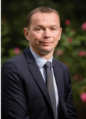
Olivier Dusopt Ministre du Travail, du Plein emploi et de l'insertion

Au cours du printemps et de l'été 2022, le secteur du tourisme a connu de fortes difficultés pour recruter 300 000 salariés saisonniers. Ces difficultés sont multi-dimensionnelles : d'abord, bien sûr, la crise sanitaire qui a touché de plein fouet le secteur et entraîné la reconversion d'un certain nombre de professionnels. Et puis, le dynamisme des créations d'emploi a engendré une forte concurrence inter-sectorielle dans les recrutements.