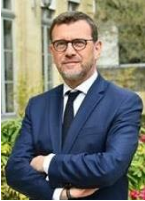
Olivier Klein Ministre délégué à la Ville et au Logement

Dans un monde où l'emploi est dynamique et la mobilité professionnelle est accrue, le logement doit s'adapter aux évolutions pour que les parcours résidentiels et professionnels s'articulent au mieux. Cette adaptation est nécessaire pour atteindre l'objectif du plein-emploi fixé par le Président de la République, elle est aussi nécessaire pour permettre aux travailleurs de se loger et de pouvoir accepter les offres d'emploi qu'ils souhaitent.